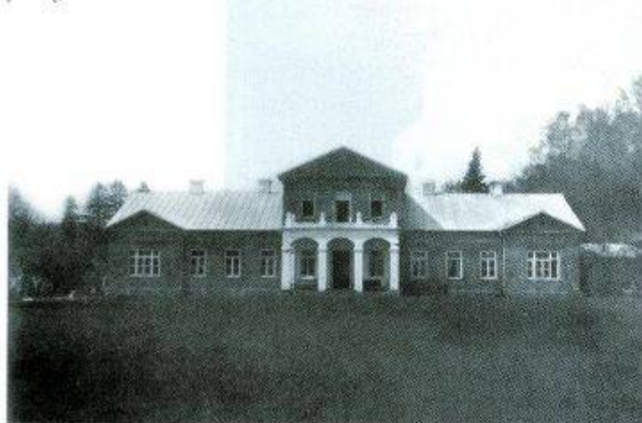
Dvaro rūmai XX a. pradžioje.