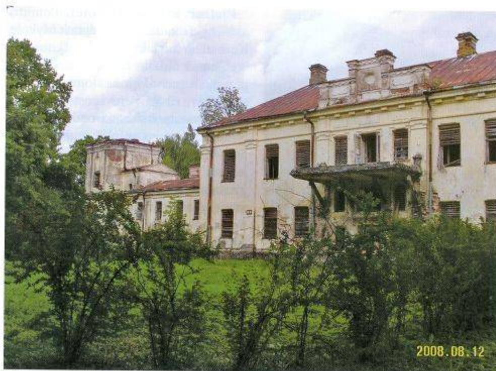
Ribiniškų dvaro rūmai