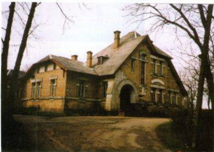
Pakiršinio dvaro rūmai

Virtuvė stovi šalia rūmų ir anksčiau jungėsi su jais uždaru praėjimu. Manoma, kad ji pastatyta XIX a. Pokario metais užstatytas mezoninas, perplauotos patalpos. Autentiška tik plano konfigūracija, iš dalies pirmo aukšto fasadai. Stilistinių architektūros bruožų nėra. Iki Pirmojo pasaulinio karo čia