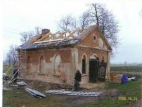
Kalvė prieš restauraciją