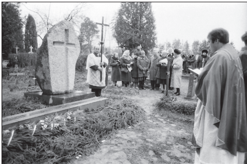
Paminklo nacionaliniams partizanams atidengimo iškilmės Lyksnoje (Daugpilio nuovas), 1994 m. lapkričio 17 d.

Į partizanų gretas stėjo įvairiausių visuomenės sluoksnių, įvairiausio amžiaus žmonės. Nacionaliniai partizanai veikė atitinkamo istorinio periodo visuomeninį, ekonominį ir politinį vystymąsi, nes SSSR valdžios įstaigoms partizanai trukdė „išsišknyti“, kova su partizanais reikalavo lėšų iš valstybės biudžeto, taip pat žmonių resursų. Partizanų veikla veikė ir visuomenę – vieni jautė jiems simpatiją ir padėjo, kitiems jie pakenkė ir kėlė baimę. Nacionalinių partizanų klausimas vis dar labai neaiškus ir vertinamas nevienareikšmiškai, todėl kiekvienas tyrimas, skirtas partizanų veiklai tirti, yra labai svarbus.