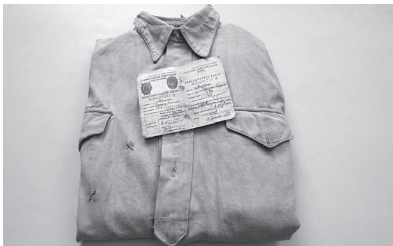
Komjaunimo sekretoriaus Z. Miglano komjaunuolio pažymėjimas ir kareiviški marškiniai su kulų pėdsakais. 2017 m. Daugpilio istorijos ir meno muziejus.