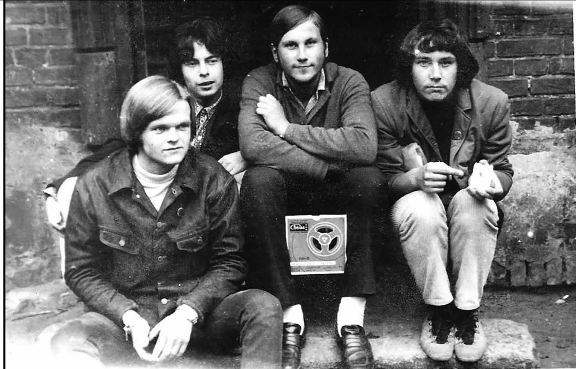
Bendraminčiai. XX a. 7–8 deš.

peikiamos Vakarų jaunimo mados, pasak respondento, „buvo galima pamatyti, kaip jie atrodo“ 42 . Muzikos sklaidą pastūmėjo ir kitos technologinės naujovės. Apie 1967-uosius jaunimas jau persirašinėjo muziką tėvų nupirktais magnetofonais 43 , rinko informaciją apie Vakaruose gyvenančių bendraamžių kultūrinės naujoves ir bendraminčių rateliuose kūrė savo subkultūrinę aplinką.