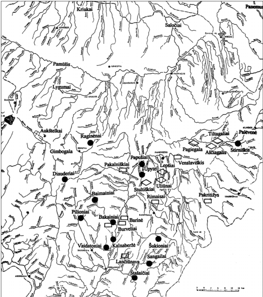
3 pav. Uplytės žemės ribos II tūkst. pradžioje – XVI a.

Juodi apskritimai – piliakalniai, keturkampiai – X–XIII a. kapinynai, rombai – XV a. kapinynai, pavadinimai be ženklų – XVI a. Uplytės pavieto ribinės gyvenvietės.